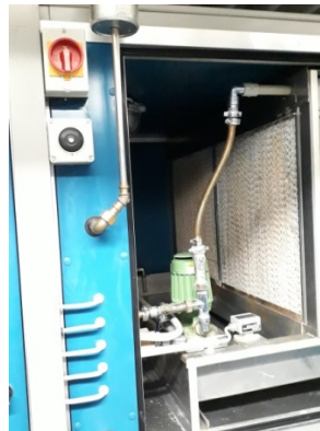
HLK Anlage hinter Anlageschalter