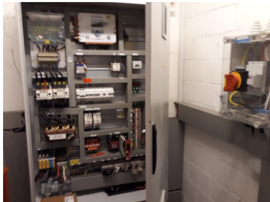
Aufzugsanlage hinter Anlageschalter

Voraussetzungen für die Service- und Reparaturarbeiten gemäss Art. 14 Abs. 4 und Art. 15 Abs. 4 der Verordnung über elektrische Niederspannungsinstalltionen (NIV) sowie der Umfang der Kontrolle nach solchen Arbeiten